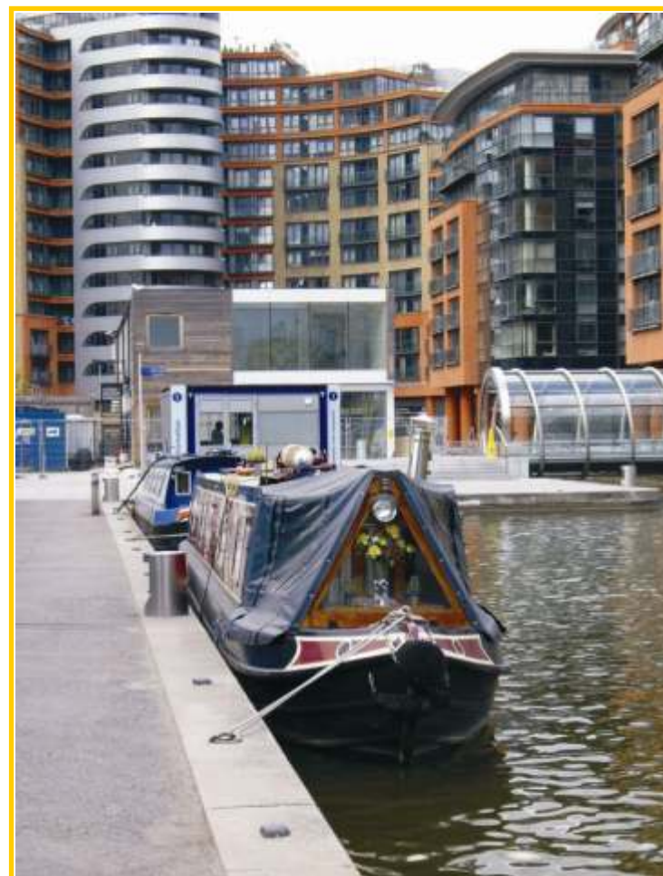
Nad vodou